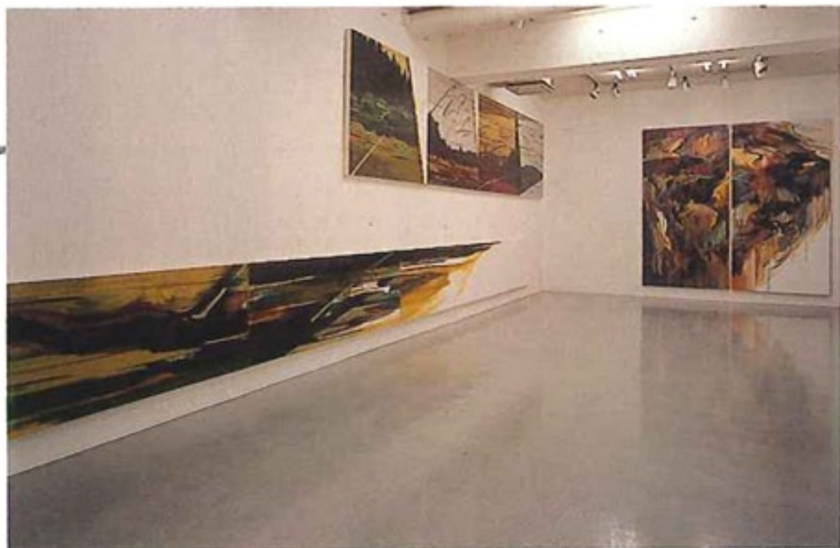
「M300<mag fuj ino> 2」 62.5×724 (4枚組)、中「M299<mag fuj ino> 1」 110×500 (4枚組)、右「M301<mag fuj ino> 3」 220×220 (2枚組)