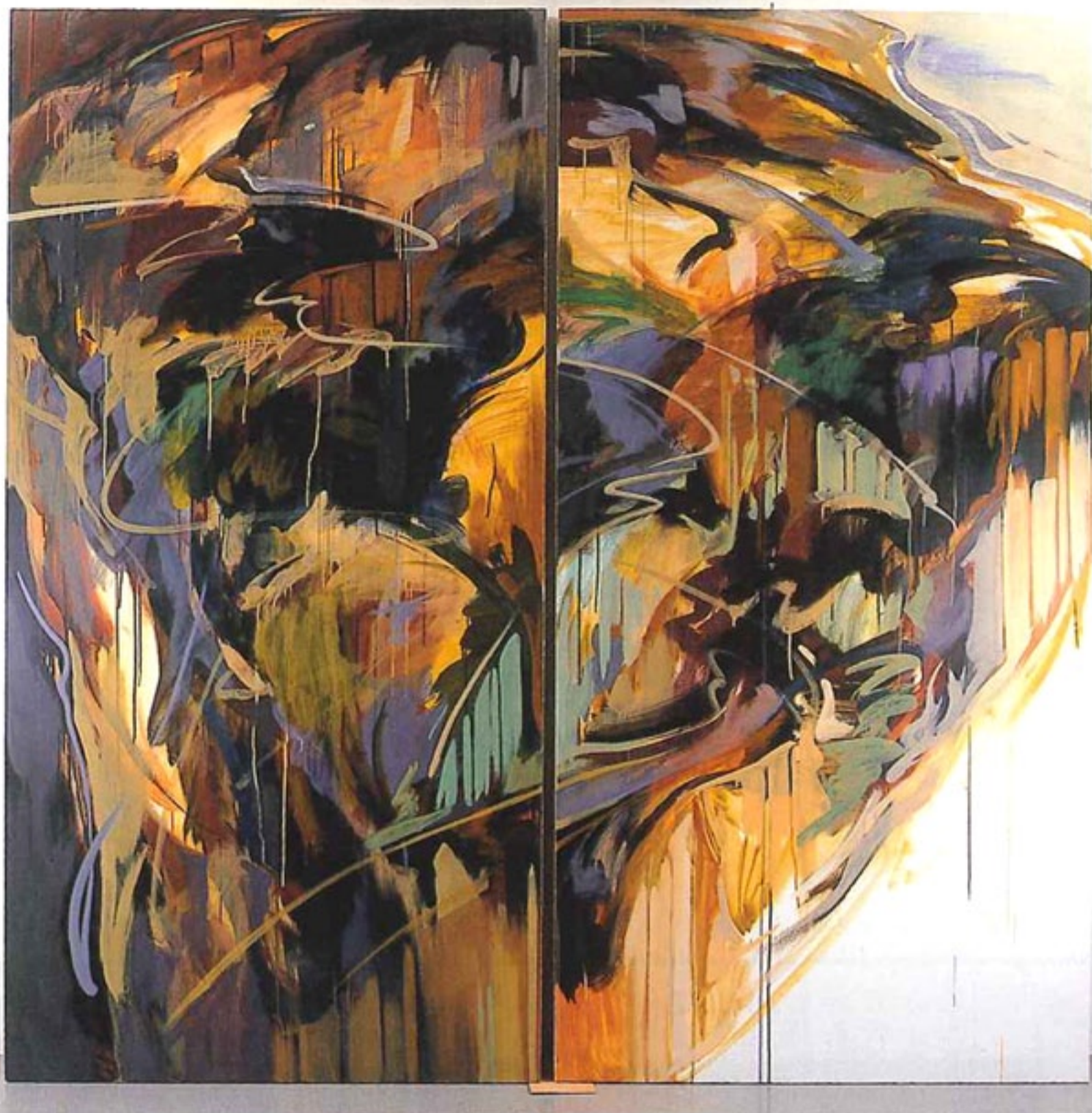
「M301<mag fuj ino> 3」 220×220 (2枚組) アクリル、油彩、綿布 2001 撮影：町田康範